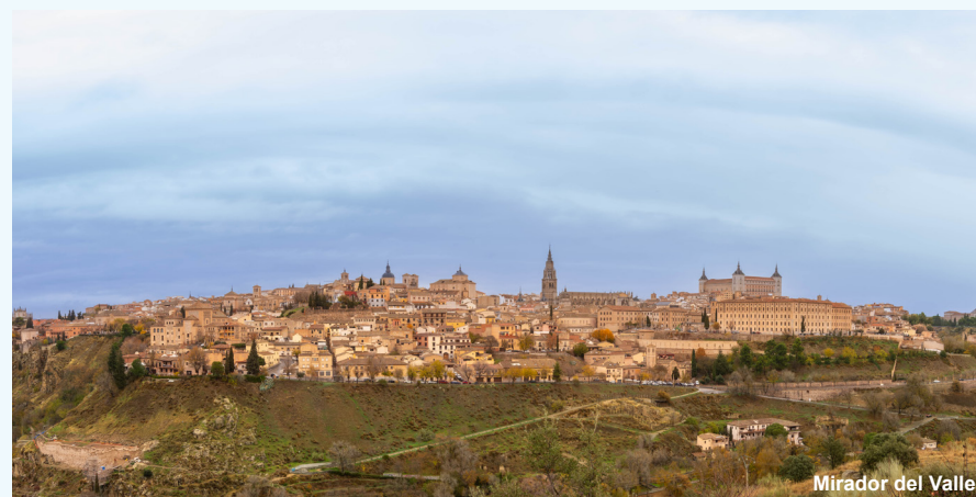
Mirador del Valle

La vista de Toledo desde el Mirador del Valle, especialmente la panorámica nocturna, ha sido elegida como la más bonita del mundo en enero de 2022.