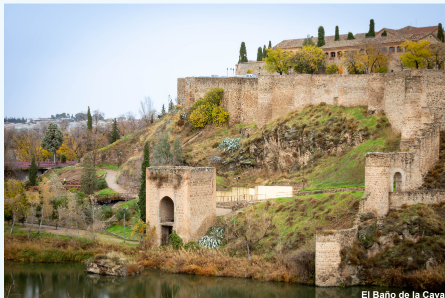
El Baño de la Cava

Después sobresaltado el ermitaño y acompañado por los del arrabal con teas encendidas encontró el cuerpo de Florinda fallecida, se levantó por sí solo y fue a sumergirse en el río.