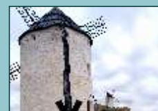
Molino del Tío Zacarías