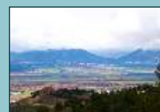
Panorámica del Valle del Algodor