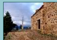
Ermita de San Blas