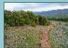
Cañada Real de las Merinas

San Blas, patrón de la localidad, tiene su ermita del siglo XVI sobre un emblemático cerro donde, en los primeros días de febrero, se organiza una gran fiesta y romería. Muy cerca se pueden visitar una antigua mina de hierro a cielo abierto de origen desconocido que pudo ser explotada hasta principios del siglo XX.