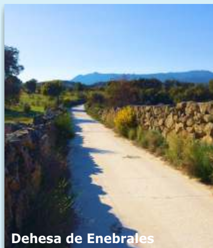
Dehesa de Enebrales