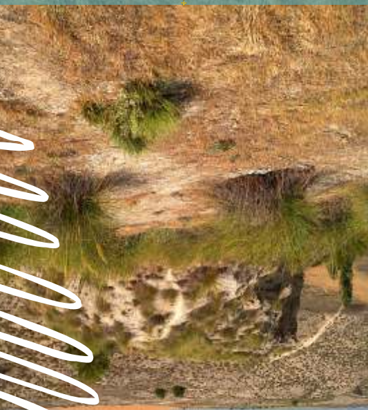
Santa Cruz de la Zarza