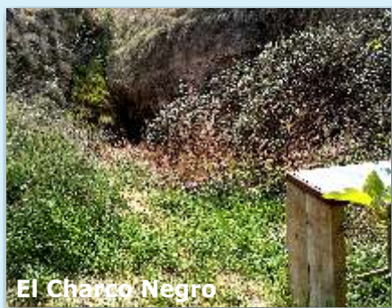
El Charco Negro