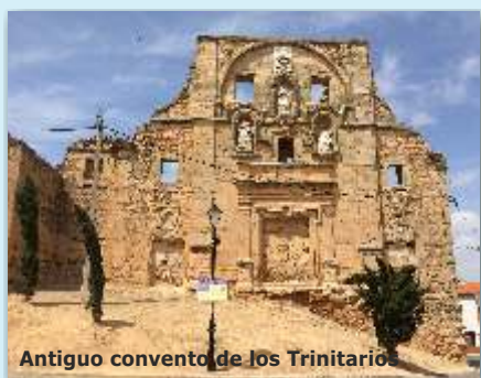
Antigua casa de los Trinitarios

Por su situación estratégica domina todo el valle del Tajo. Ha sido lugar defensivo y de comunicaciones desde la época romana. Desde el siglo XII perteneció a la Orden de Santiago. En el casco urbano se encuentran casas-palacio con profusión de escudos señoriales. Santa Cruz de la Zarza es un pueblo acogedor que se ha adaptado a los tiempos presentes, teniendo una importante industria de la madera y buenos productos agroalimentarios como el vino, el aceite y el queso.