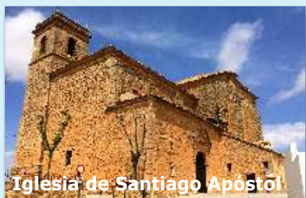
Iglesia de Santiago Apóstol

Santa Cruz de la Zarza pertenece a la Comarca de La Mesa de Ocaña. Se encuentra en un sitio privilegiado: al sur la llanura de la Mesa de Ocaña y al norte la depresión del Tajo. En el norte, cerros yesíferos con el tomillo, el esparto y el olivo, en cambio al sur abunda la encina, el viñedo y las tierras de labor.