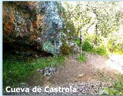
Cueva de Castrola