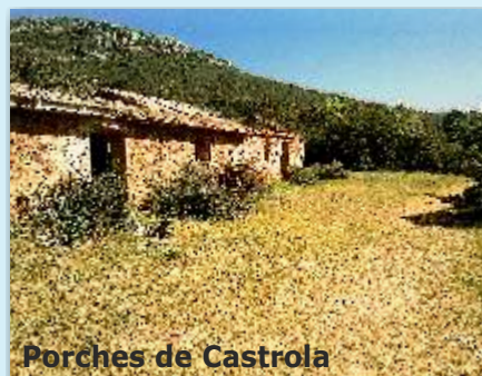
Porches de Castrola

El núcleo urbano se encuentra situado a una altitud de 688 metros y su población supera los 11.000 habitantes. Podemos encontrar diversidad de paisajes debido a que el término se encuentra dividido en dos comarcas naturales, Los Montes de Toledo y La Mancha, apareciendo ecosistemas muy diferentes propios de cada una de las zonas. Sumergido en el corazón de La Mancha, Madriddejos también destaca por su excelente producción de quesos, aceites, vinos y azafrán.